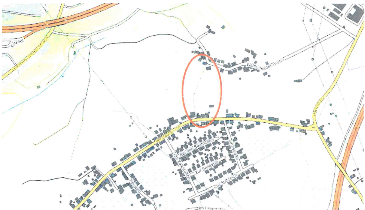
Abbildung 1: Fußweg Wahlschieder Grube

Die BfB-Ortsratsfraktion bittet um eine eingehende Beantwortung.