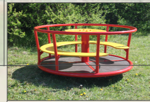
Karussell mit Rundbank