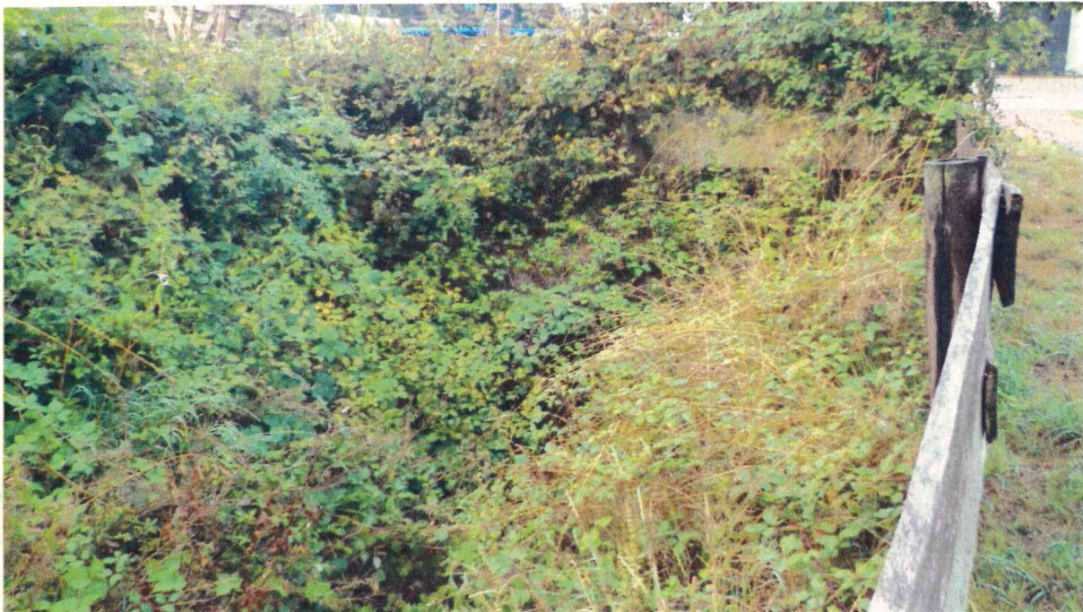
Verkrautung am Wahlbachdurchlass am 17.08.2020

Daher wird zur Vorsorge vorgeschlagen, dass mindestens im monatlichen Abstand das Bauwerk und bei Starkregenwarnungen der öffentlichen meteorologischen Dienste (Deutscher Wetterdienst, Landesamt für Umwelt und Arbeitsschutz des Saarlandes) seitens der Gemeinde überprüft wird und ggf. umgehend Maßnahmen zur Herstellung der Funktionsfähigkeit eingeleitet werden. Als Nachsorge wird vorgeschlagen zeitnah nach Ablauf eines Starkregenereignisses den Durchlass zu kontrollieren und Geschwemmsel zu entfernen.