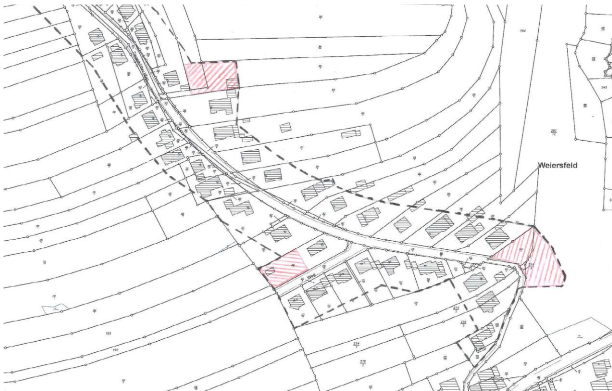
Abbildung 3: Außenbereichsflächen, die noch in den Innenbereich eingezogen werden