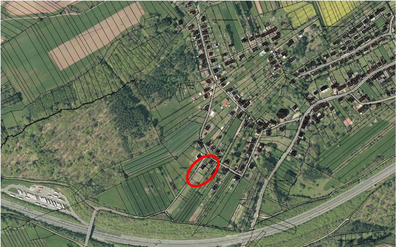
Abbildung 2: Lageplan

lich erfolgt der Übergang in die freie Landschaft. Das Gelände fällt leicht von der Straße in östliche und südliche Richtung ab.