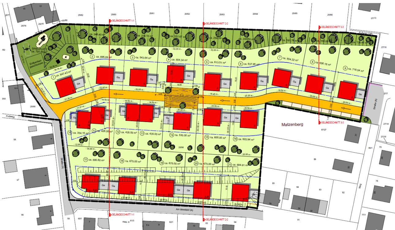
Abbildung 2: Städtebauliche Konzeption der Sportplatzfläche

kleinen Quartiersplatz hergestellt werden. An dieser sollen 16 Baugrundstücke mit Grundstücksgrößen von ca. 350 m 2 bis 1.050 m 2 angeschlossen werden. 5 Baugrundstücke können direkt von der Straße „Am Westfeld“ erschlossen werden. Im Bereich der fußläufigen Zuwegung zur Straße „Zu den Hütten“ soll ein neuer Spielplatz errichtet werden. Neben der Spielplatzfläche ist das erforderliche, geschlossene Regenrückhaltebecken geplant.