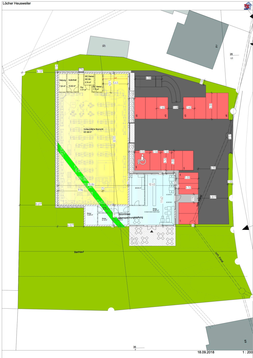
Abb.: Lageplan

Durch die Lage innerhalb des bebauten Siedlungskörpers wird dem Grundsatz Innen- vor Außenentwicklung nachgekommen.