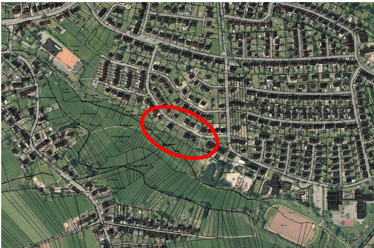
Abbildung 1: Lageplan

Die genaue Abgrenzung des Geltungsbereiches ist der Planzeichnung zum Bebauungsplan zu entnehmen.